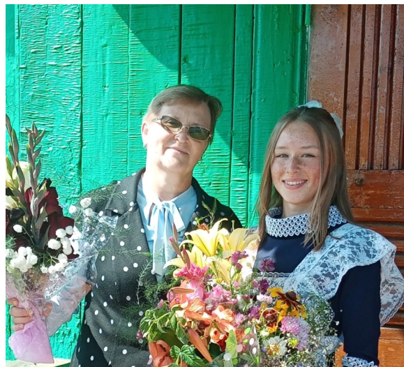
Коллектив Горячинской школы